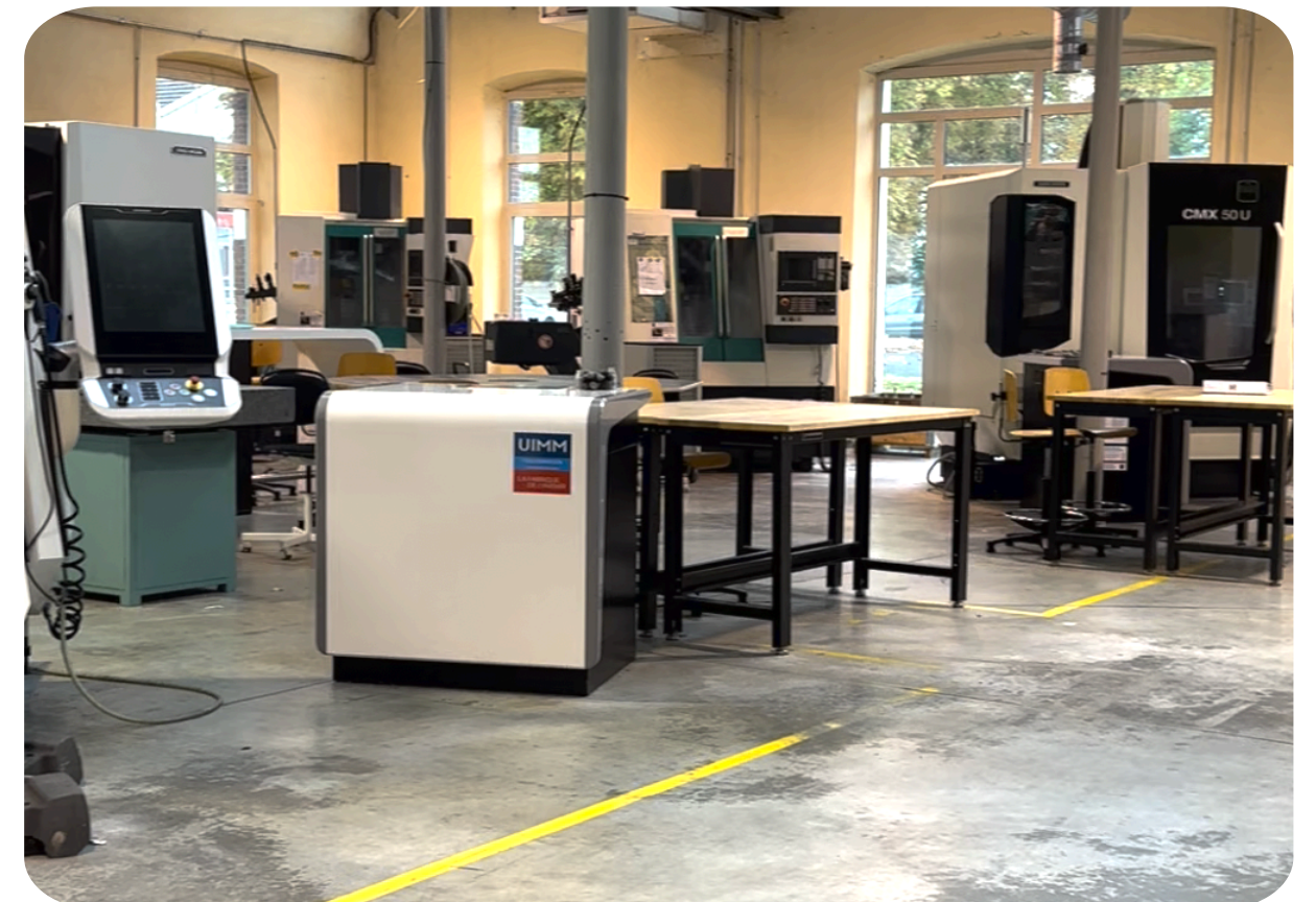
Visite des ateliers du Pôle Formation